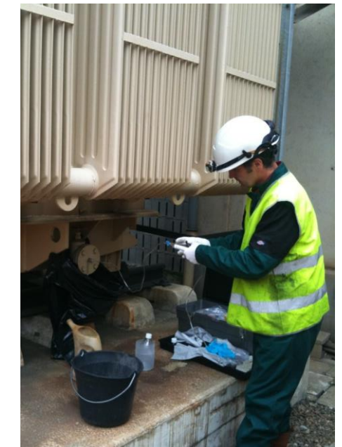
Prestation de prélèvement