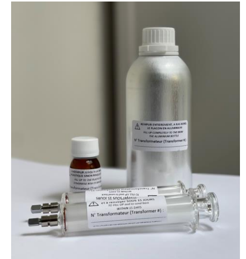
Exemple de kit de prélèvement

88 % de nos clients recommandent notre matériel et la prestation de prélèvement